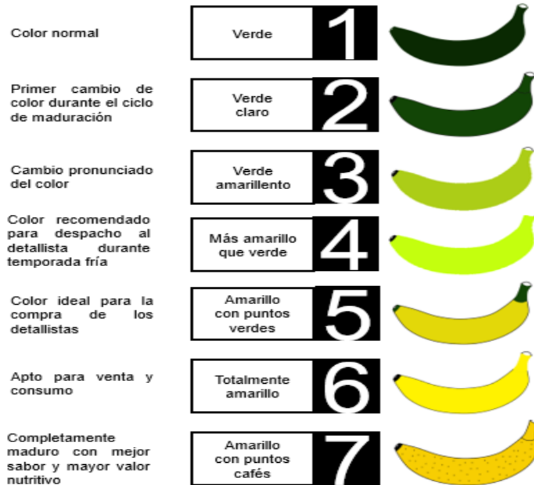
Figura 2. Escala para la evaluación del grado de maduración en el banano (Soto, 2008).

Para la evaluación del grado de maduración en el banano se utilizó la escala de Soto (2008). Se evaluó durante 21 días (tiempo que tarda el fruto de banano en llegar a su destino final), teniendo en cuenta que la coloración del fruto parte desde verde hasta amarillo con pecas oscuras, lo cual significa que alcanzó su etapa de madurez. Esta escala de maduración tiene 7 niveles, el nivel 1 es el fruto color verde; 2: verde claro; 3: verde amarillento; 4: más amarillo que verde; 5: amarillo con puntos verdes; 6: totalmente amarillo y 7: amarillo con puntos café (Figura 2).