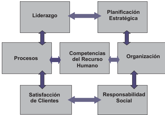
Diagrama 2 Modelo para medir la innovación en el sector servicios