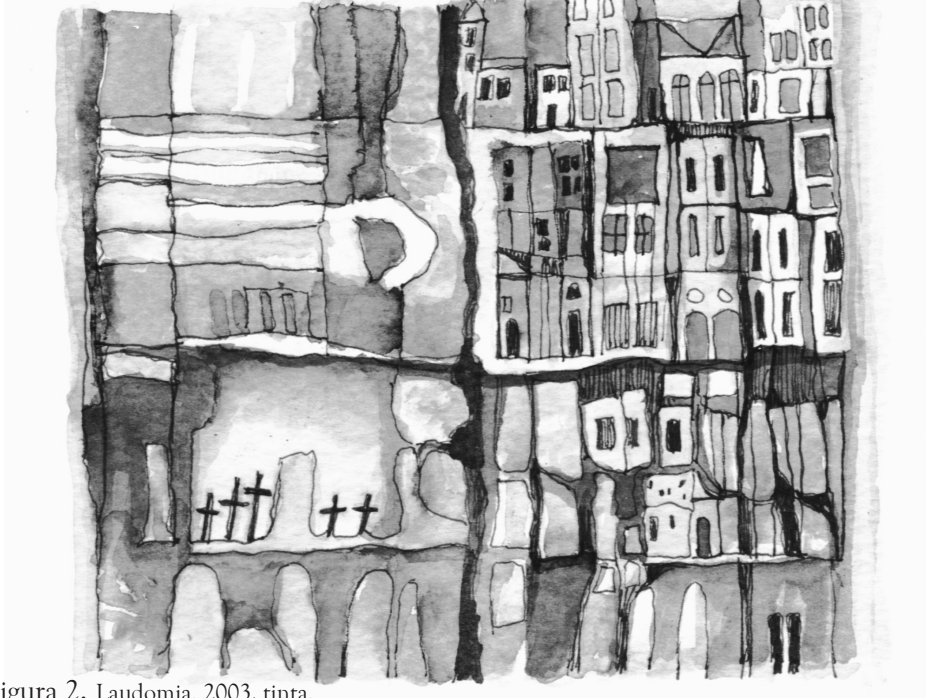
Figura 2. Laudomia. 2003, tinta.