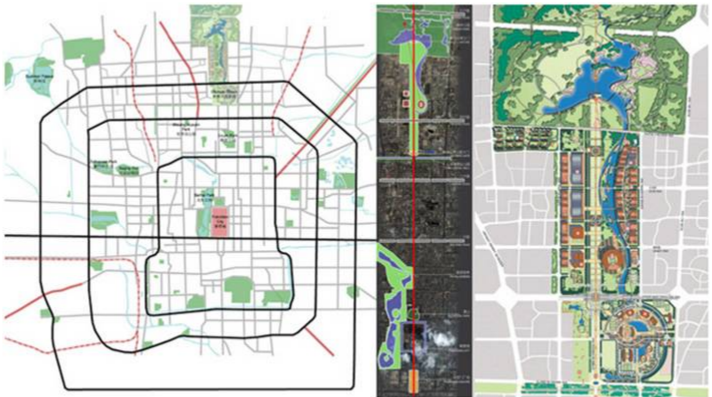
Gráfica 1. Proyecto Beijing, 2008.

En el cinturón interior se localizó el Parque Olímpico, situado en el extremo norte del eje central de Beijing.