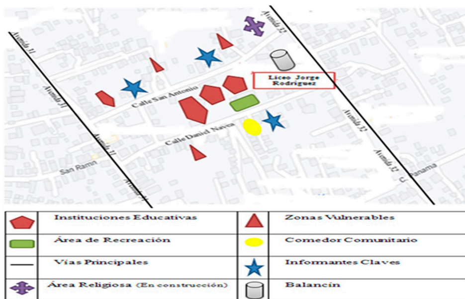
Imagen N°1. Cartograma del recorrido observacional de la Comunidad del Liceo Jorge Rodríguez.