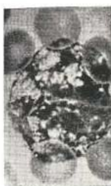
Fig. 3. Célula en cesta.