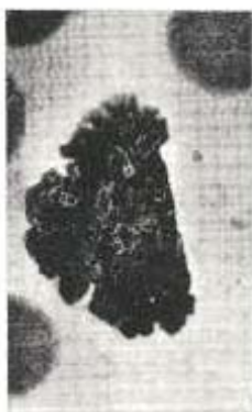
Fig. 2. Resto nuclear.