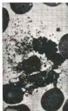
Fig. 1. Célula en lisis.