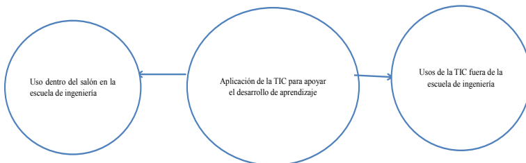
Figura 1: Unidad de significado: Aplicación de la TIC para apoyar el desarrollo de aprendizaje.

Partiendo de lo expresado anteriormente, se construyeron las categorías arrojadas por el Atlas.ti.8; para generar un constructo teórico basado en un AVA a fin de apoyar el desarrollo de aprendizaje en las universidades públicas venezolanas: caso particular en la Escuela de Ingeniería Industrial de LUZ. De esta manera, la figura 1, expone la unidad de significado: Aplicación de la TIC para apoyar el desarrollo de aprendizaje. La elaboración es propia de la autora, a partir del proceso de codificación.