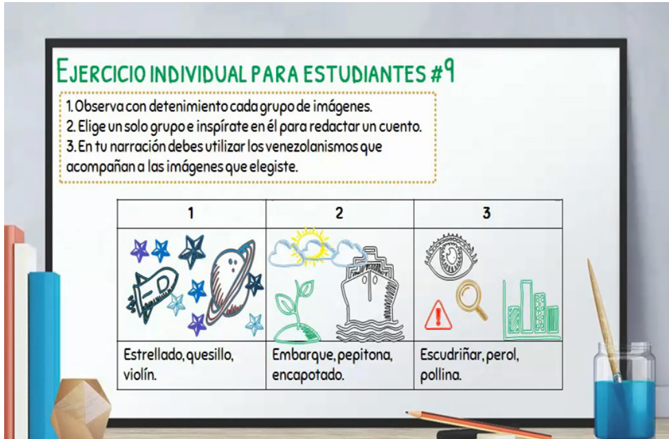
Imagen 1. Modelo de ejercicio de escritura en la Unidad Didáctica de Adjetivos

información teórica, sino verla desde la práctica y el uso (Martín, 2004), esta vez estimulada a partir de venezolanismos.