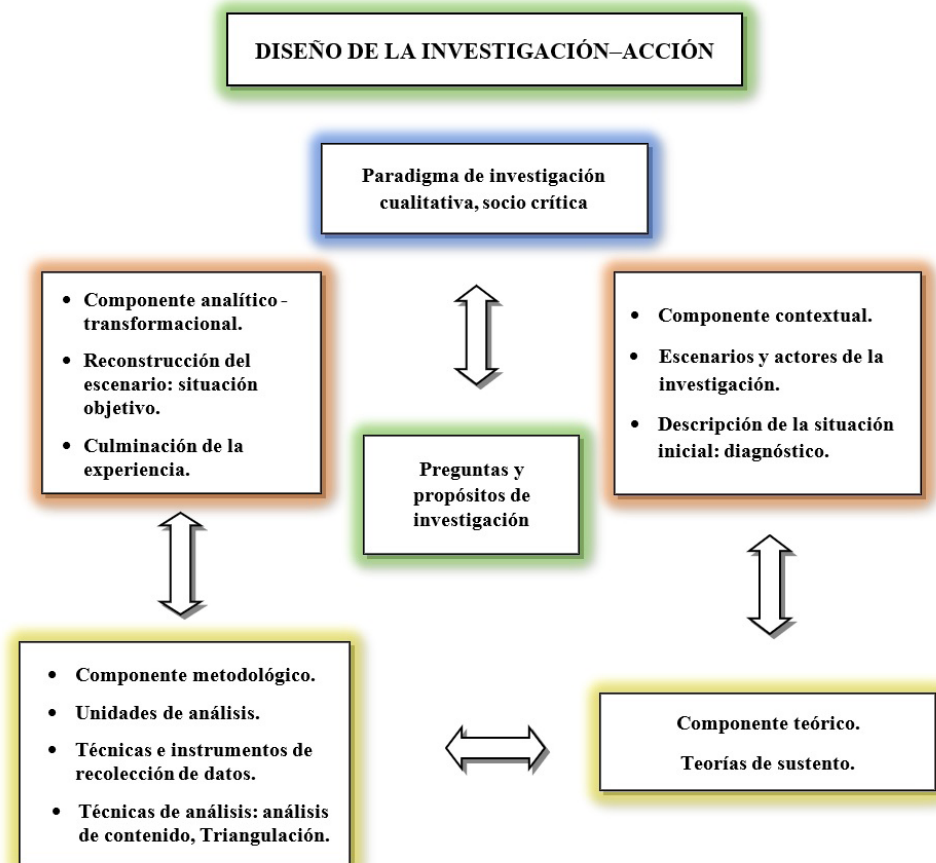
Figura 3. Diseño de la Investigación–Acción