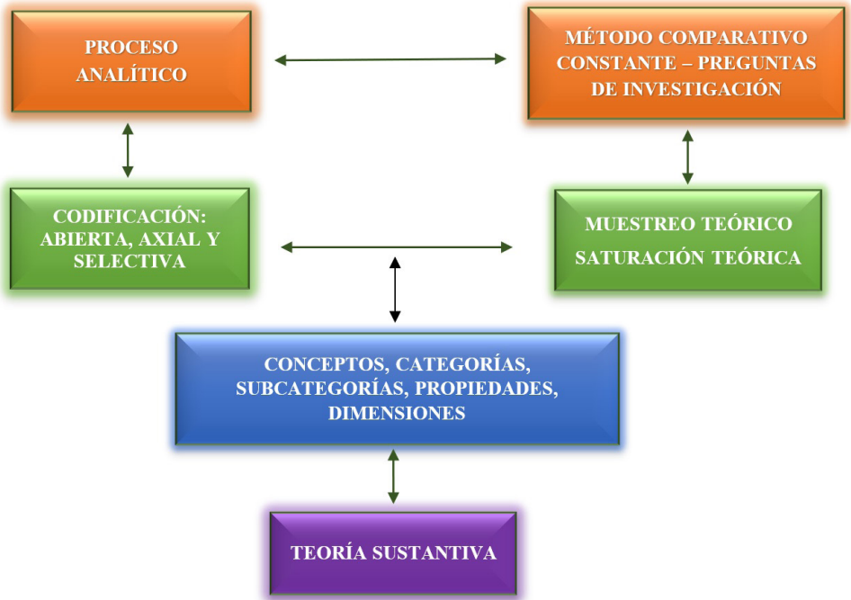
Figura 2. Sistematización del proceso de aplicación de la Teoría Fundamental