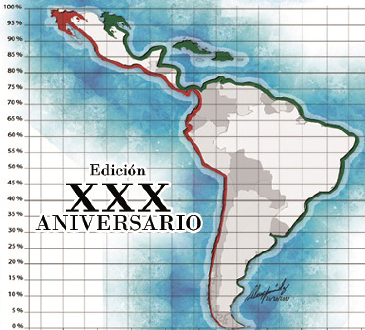
Ilustración: Alcely Fernández, 2017