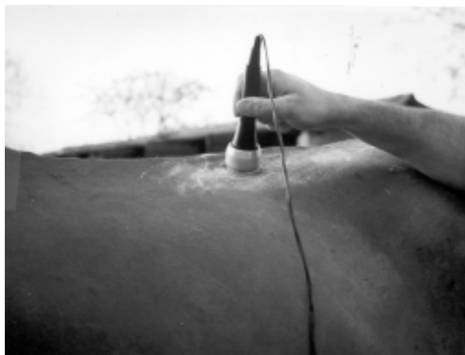
FIGURA 3. TÉCNICA DE APLICACIÓN DEL CABEZAL DE ULTRASONIDO. OBSÉRVESE LA ZONA A TRATAR CUBIERTA CON GEL.