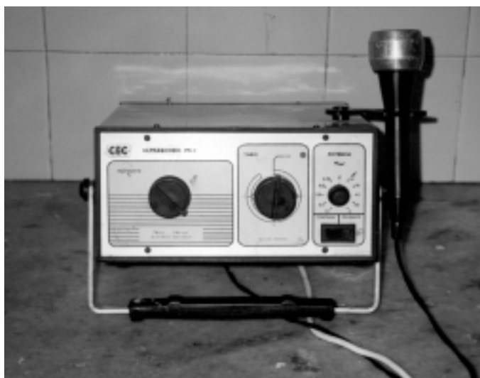
FIGURA 1. APARATO DE ULTRASONIDO MARCA CEC, POTENCIA MÁXIMA DE 3 WATT-CM2, TIMER DE 15 MINUTOS Y GRADUACIÓN DE PULSOS.