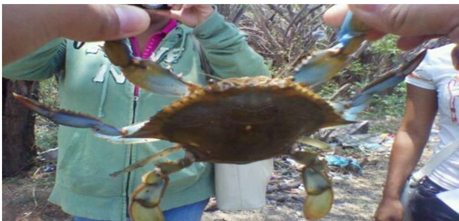
Figura 3. Individuo de cangrejo Azul ( C. sapidus ) del sector Parque la Laguna Azul (LA), municipio Cabimas - Estado Zulia, conseguido por los pescadores entrevistados.

Para entender mejor estas diferencias y su impacto en la sostenibilidad de la pesca del cangrejo azul, es necesario investigar la eficacia y el impacto ambiental de cada arte de pesca, así como su viabilidad a largo plazo en cada localidad. La implementación de medidas de manejo adaptadas a cada zona podría ser crucial para proteger esta especie y mantener el equilibrio de los ecosistemas acuáticos (Gatica y Hernández 2003). La captura del cangrejo azul ha surgido como un desafío creciente debido a la sobreexplotación, agravada por la falta de conocimientos técnicos y herramientas adecuadas. En zonas como el Boulevard Costanero de Cabimas y el parque La Laguna Azul (Fig. 3), esta problemática puede llevar a interferencias en el crecimiento y abundancia de la especie (García-Pinto et al. 2013).